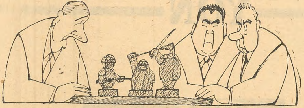
ORTA DOĞUDA SATRANÇI.

Demirel iktidarının Orta Doğu buhranı karşısındaki tutumu, Menderes döneminde nazaran ve kendi dış politika anlayışı çerçevesinde hayli olumlu olmuştur. İkili anlaşmalar ve daha birçok türlü çeşitli ilişkiler