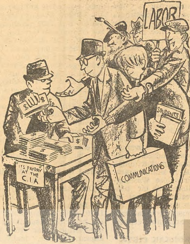
CIA'DA PARA ÖDEME GÜNÜ

Öğrendiğimiz en şeytani metotlardan biri de, «mini-top» adı verilen bir icattı. Bu top, plâstik